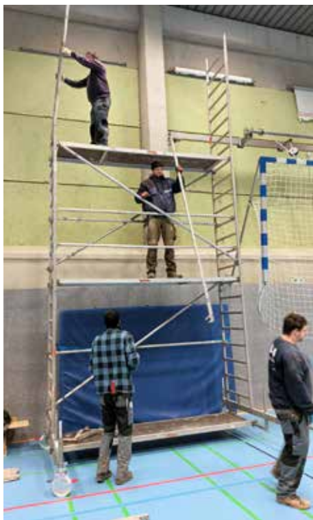
Aufbau des Rollgerüsts durch die Fa. Clermont, entfernen des alten Rollosystems, Anbringung des neuen sowie Bestückung mit den z.T. neuen Werbe rollos.